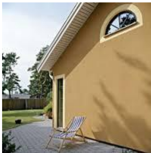
Var finns fuktriskerna i detta hus?