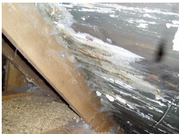
Inläckage eller ventilationsproblem?

Kursen vänder sig till de som arbetar praktiskt med fastighetsdrift, såsom service av tekniska installationer och övrig tillsyn av fastigheter. Syftet med kursen är att du som fastighetstekniker ska få grundläggande fuktkunskaper som kan behövas för att rondera byggnader, hantera vattenskador samt kunna göra en första bedömning när någon hyresgäst eller nyttjande klagar på inomhusmiljön i sin bostad eller på sin arbetsplats.